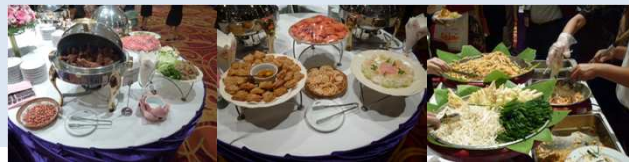
Convention Linkage, Inc.