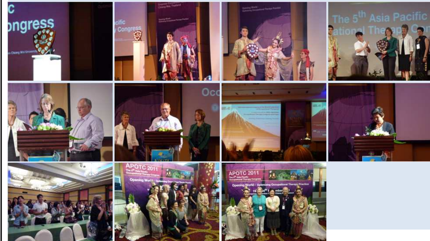
Convention Linkage, Inc.