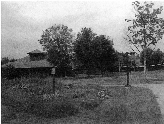
図2 フォーウィンズ入院棟

られないとのことであった。日本の精神病院とスタッフ数、物理的環境も全く違っていて羨ましさを感じたが、マネジドケアによる経済的影響が、治療内容を左右していることを対象者はどう感じているのか心配になった。