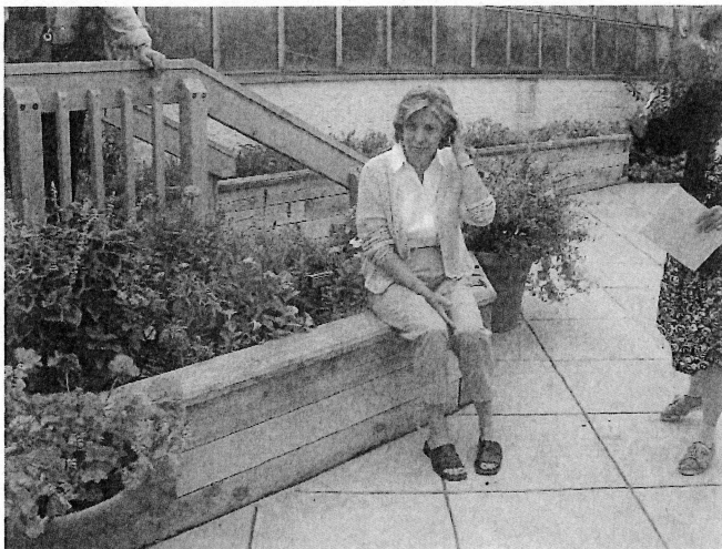
図3 セラピューティックガーデンで説明するカリン米園芸療法協会長