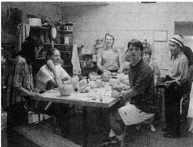
図4 メルマークホーム作業室

うが、実際の活動は園芸療法士が行っていた。見学当日は実際に6名ほどのグループセッションに参加させてもらい、患者さんと一緒に園芸活動を通して関わることになった。言葉は通じなくても、表情やジェスチャーで十分気持ちは通じると感じ、楽しい時間を過ごすことができた。